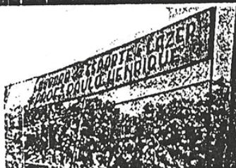
A quadra é utilizada durante toda a semana pela comunidade.

As modalidades oferecidas são as seguintes, nas atividades